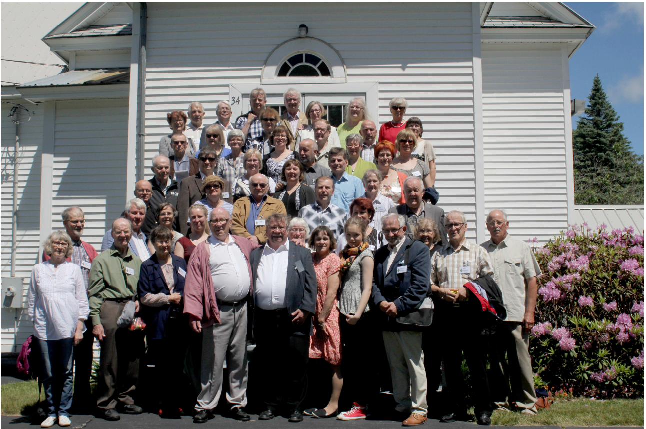
Matkaseurue Trinity Lutheran Churchin portailla jumalanpalveluksen jälkeen.

Keiketyks ja paikallinen Lorainen kanteleryhmä järjestivät sunnuntaina 16.6. yhteisen konsertin suurelle yleisölle southparisilaisessa The Forum Oxford Hills High Schoolissa. Auditorio oli viimeistä paikkaa myöten täynnä. Kanteleryhmän esitys alkoi Amerikan ja Suomen kansallislauluilla ja Finlandialla sekä päättyi Amerikan ja Suomen lippulauluihin. Tunnelma oli koskettava ja mieleen jäävä. Keiketyksen repertuaaliin kuului luontevaa ja iloista tanhuamista.