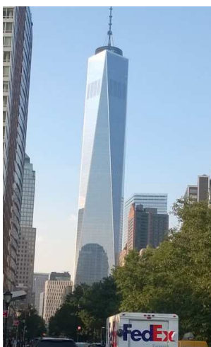
One World Trade Center.

Rakennukset Manhattanilla olivat jopa satojen metrien korkuisia. Korkein rakennus on vuoden 2014 keväällä avattu One World Trade Center. Se on lähes 550 metrin korkuinen (antenni) ja 104 kerroksinen. Rakennuksen hinnaksi tuli 3,9 biljoonaan USdollaria. Toiseksi korkein rakennus on Empire State Building, jonka korkeus on 381 metriä.