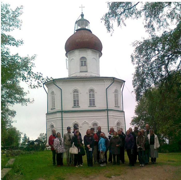
Retkikunta kiipesi "Stalinin portaita" Sekirnavuorelle, jossa sijaitsi Svjato- Voznesenksin skiitta eli sivuluostari. Matkaopas kertoi, että neuvostoaikana paikalla tehtiin käsittämättömiä raakuksia sinne joutuneille polittisille vangeille.