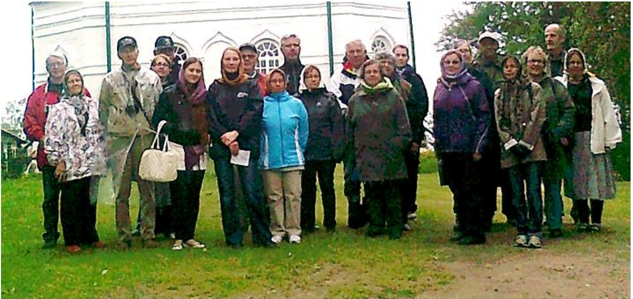
Matkaseurue Sekirnajavuoren skiitan kirkon edustalla.