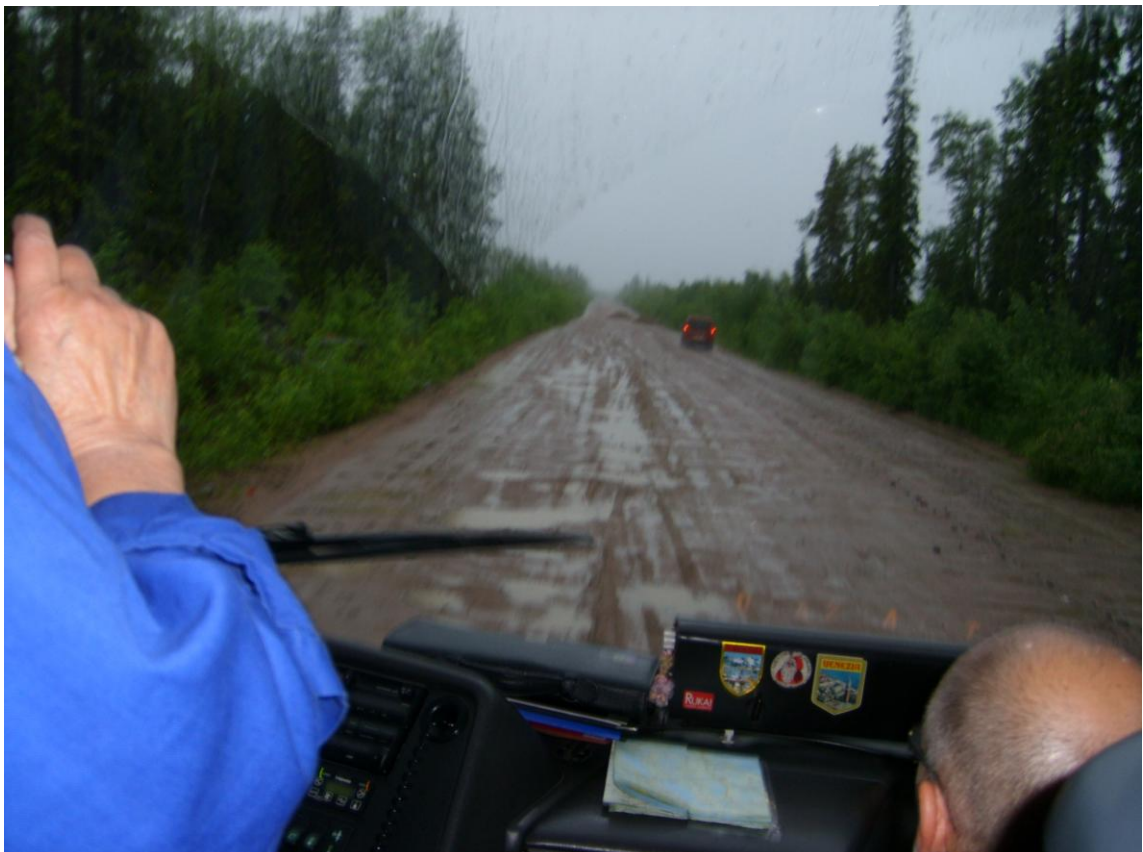
Kotimatalla yllätti sade ja kuraiset "autobaanat".