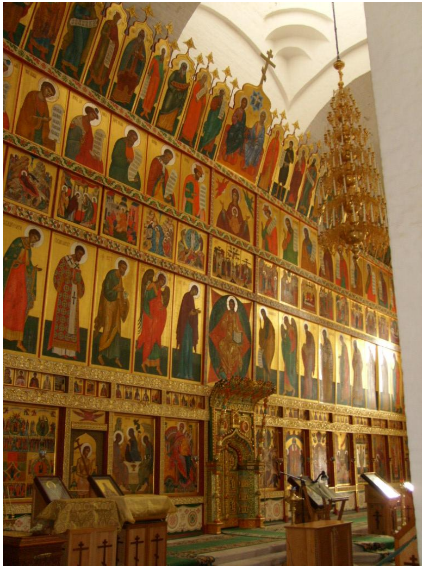
Luostarin pääkirkon ikonostaasi.