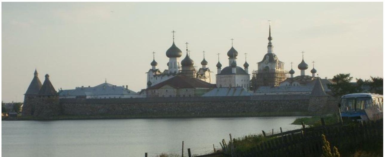
Solovetskin luostari mereltä päin katsottuna