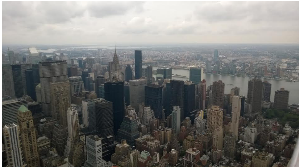
Näkymä Empire State Buildingin 85. kerroksen näköalatasanteelta.

Toisena ja kolmantena New Yorkin matkapäivänä jäi aikaa shoppailuunkin. Toisen päivän iltapäiväksi oli sovittu tapaaminen Yhdistyneiden Kansakuntien päämajassa. Matkalla sinne poikettiin kuuluisaan New York Public Libraryyn. YK:ssa tutustuttiin aluksi yleisiin tiloihin. Mieliin painuva kokemus oli erääseen käytävään nähtävälle asetettu koulu, joka mahtui matkalaukkuun, ilman opettajaa kuitenkin. Tällaisille kouluille on tarvetta mm. Afrikan maissa. Yleiskokouksen istuntosali oli tuolloin remontissa, mutta pääsimme tutustumaan lähemmin turvallisuusneuvoston tiloihin ja toimintaan.