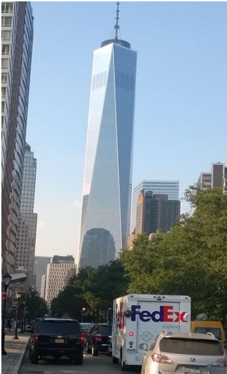
One World Trade Center.

Rakennukset Manhattanilla olivat jopa satojen metrien korkuisia. Korkein rakennus on vuoden 2014 keväällä avattu One World Trade Center. Se on lähes 550 metrin korkuinen (antenni) ja 104 kerroksinen. Rakennuksen hinnaksi tuli 3,9 biljoonaan USdollaria. Toiseksi korkein rakennus on Empire State Building, jonka korkeus on 381 metriä.